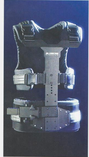
Жилет Glidecam X-10

Материал предоставлен компанией Synchro-Pro