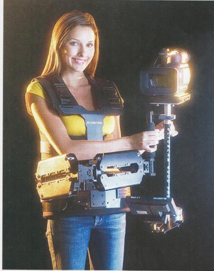
Система Glidecam X-10

Новая профессиональная система стабилизации камеры Glidecam X-10 разработана для профессиональных видеокамер массой 3...5 кг. Она используется совместно со стабилизирующими устройствами Glidecam 2000 PRO и Glidecam 4000 PRO. Glidecam X-10 позволяет оператору при съемках идти, бежать, двигаться вверх и вниз по лестнице, снимать с мотоцикла и автомобиля, передвигаться по неровной поверхности, получая стабильную картинку.