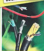
Кабель в бухтах