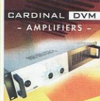
CARDINAL DVM - AMPLIFIERS -